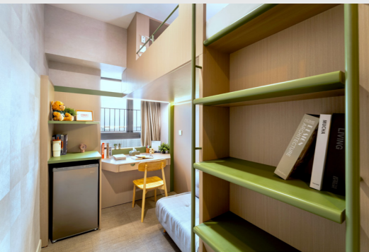
單人房 S1 - 高架床x1、沙發床x1