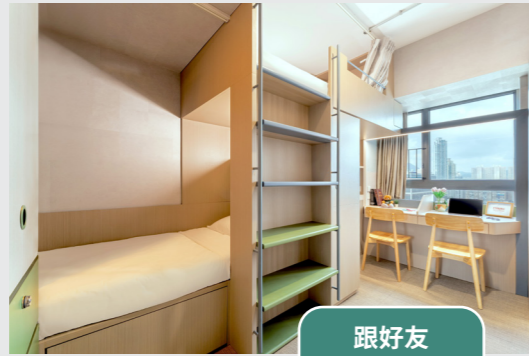
雙人房 D1 - 雙層床x1