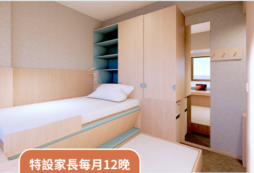
單人房 S4 - 子母床x1