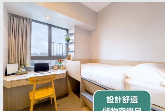
單人房 S3 - 平床x1