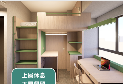
單人房 S2 - 高架床x1